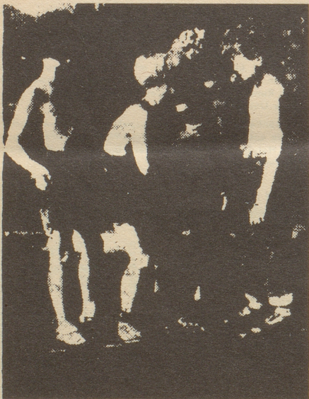
«Die Rasselbände» könnte man dieses Bild aus dem Film «Hab Sonne im Herzen» überschreiben.

Lieber Bruder. Spalte mir diesen Nebel. Ich bin gerne bereit, Dir bei Gelegenheit meine Dienste ebenfalls anzubieten.