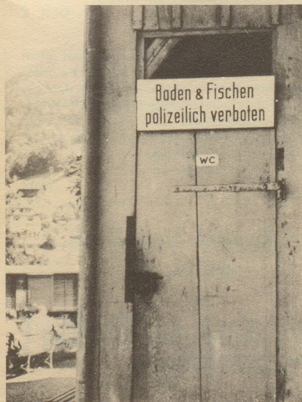
s wird au niemerem iifale!