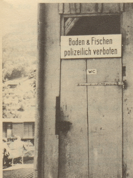
s wird au niemerem iifale!