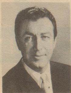
Robert Taylor, Star des MGM-Films «Das grosse Geheimnis» (Above and Beyond)

Wenn Ihre Haarpapillen den Haarboden nicht mehr vollkommen ernähren - wenn Sie unter Schuppen leiden, dann erinnern Sie sich: