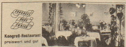
Kongress-Restaurant preiswert und gut