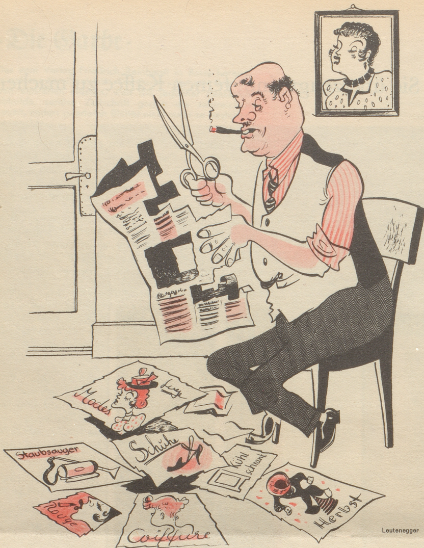
Der Zensor: Bevor Pfrau Zitig i dHänd überchunnt müesse die gfährliche Inserat use!