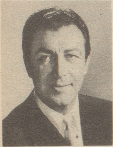
Robert Taylor, Star des MGM-Films «Das grosse Geheimnis» (Above and Beyond)

Wenn Ihre Haarpapillen den Haarboden nicht mehr vollkommen ernähren - wenn Sie unter Schuppen leiden, dann erinnern Sie sich: