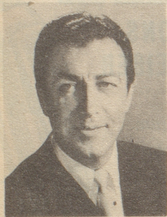
Robert Taylor, Star des MGM-Films «Das grosse Geheimnis» (Above and Beyond)

Wenn Ihre Haarpapillen den Haarboden nicht mehr vollkommen ernähren - wenn Sie unter Schuppen leiden, dann erinnern Sie sich: