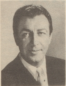
Robert Taylor, Star des MGM-Films «Das grosse Geheimnis» (Above and Beyond)

Wenn Ihre Haarpapillen den Haarboden nicht mehr vollkommen ernähren - wenn Sie unter Schuppen leiden, dann erinnern Sie sich: