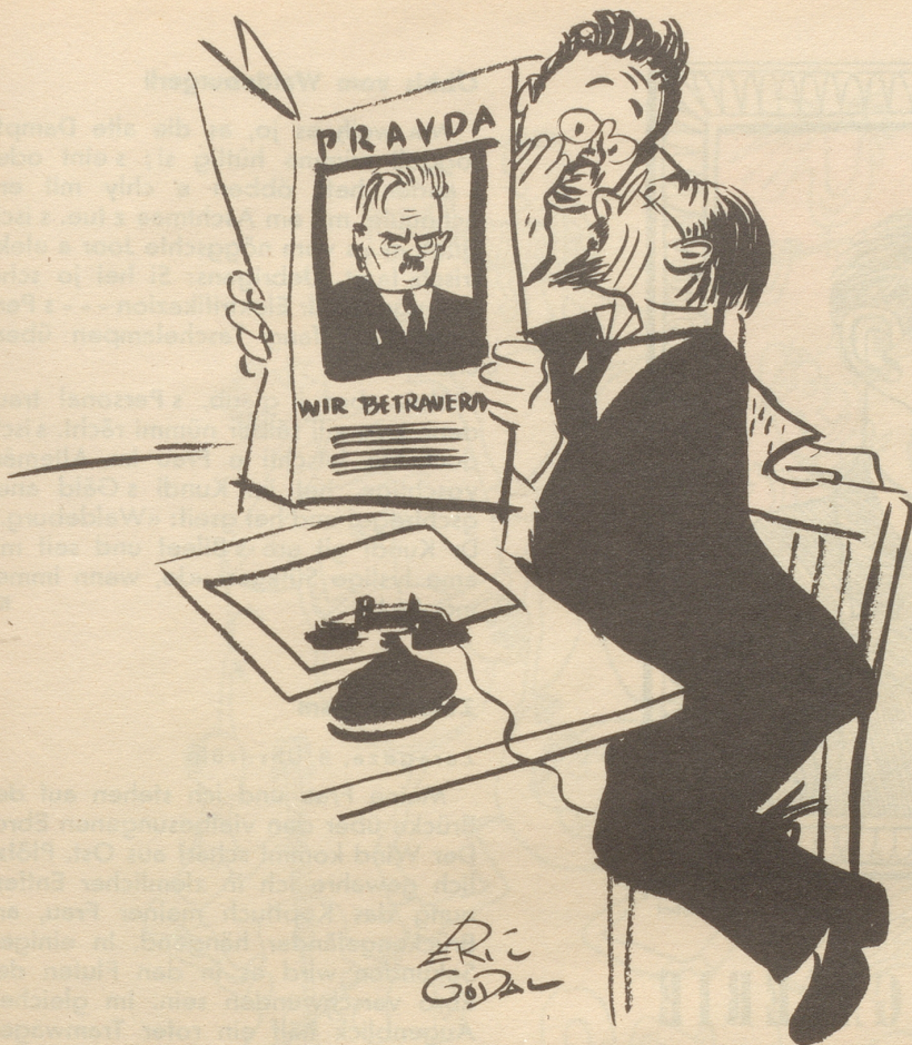
Blick hinter den Eisernen Vorhang

„Er hatte Krebs und Nierenschwund, und Differenzen mit der Partei.“