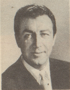
Robert Taylor, Star des MGM-Films «Das grosse Geheimnis» (Above and Beyond)

Wenn Ihre Haarpapillen den Haarboden nicht mehr vollkommen ernähren - wenn Sie unter Schuppen leiden, dann erinnern Sie sich: