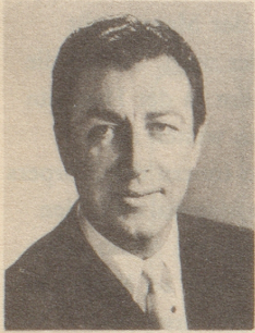
Robert Taylor, Star des MGM-Films «Das grosse Geheimnis» (Above and Beyond)

Wenn Ihre Haarpapillen den Haarboden nicht mehr vollkommen ernähren - wenn Sie unter Schuppen leiden, dann erinnern Sie sich: