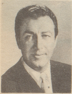
Robert Taylor, Star des MGM-Films «Das grosse Geheimnis» (Above and Beyond)

Wenn Ihre Haarpapillen den Haarboden nicht mehr vollkommen ernähren - wenn Sie unter Schuppen leiden, dann erinnern Sie sich: