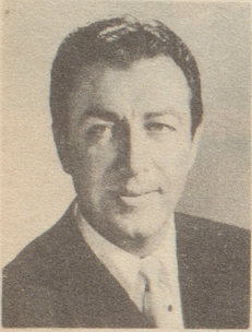
Robert Taylor, Star des MGM-Films «Das grosse Geheimnis» (Above and Beyond)

Wenn Ihre Haarpapillen den Haarboden nicht mehr vollkommen ernähren - wenn Sie unter Schuppen leiden, dann erinnern Sie sich: