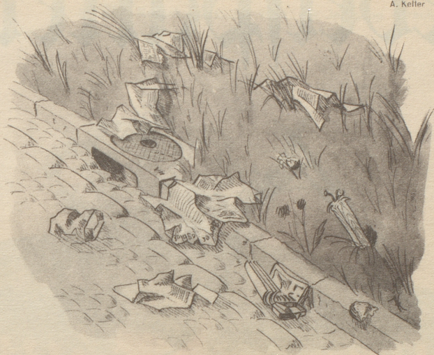
Am Aargauerstalden nach dem Historischen Umzug in Bern

«Aber wen mueß dänn de Unggle frage, wännr z Abig wott go jasse?»