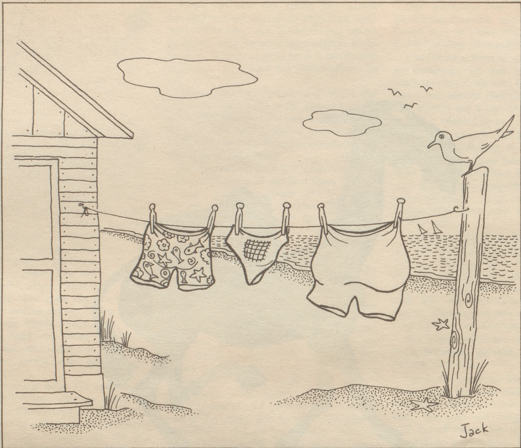
Konferenz in Bermuda