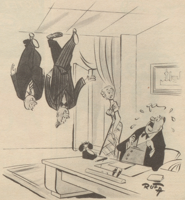
„... bitte Herr Direktor, hier kommen zwei Antipoden zu Besuch — aus Australien.“

Bedingung: Auf eine Postkarte kleben und einsenden bis 8. Juni 1953 an: Textredaktion Nebelspalter Rorschach.