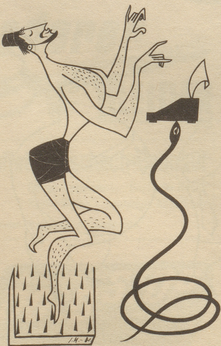
... er schreibt auf HERMES

Am Eisernen Vorhang? Wenn man einen Protest hinüberryuft, kommt ein Protest zurück. fis