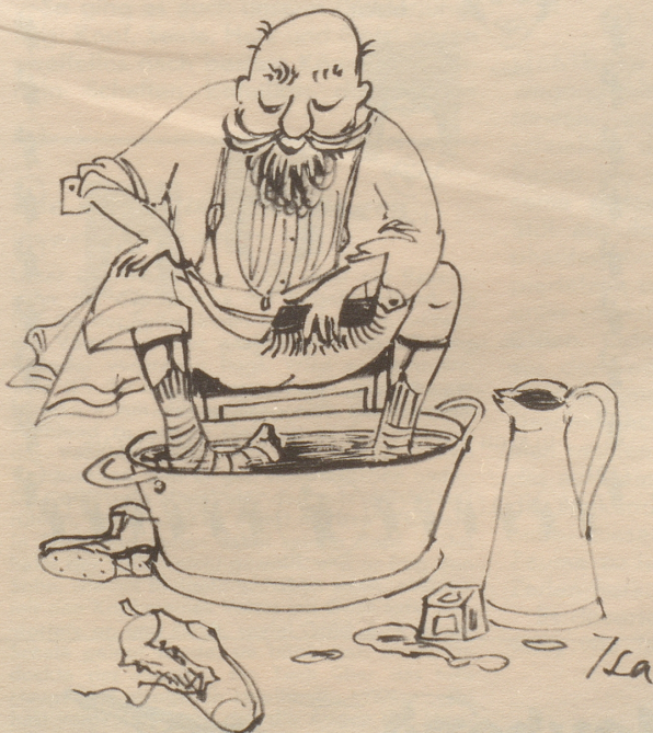
Bade im Frühling mit Vorsicht!

Hier treffen wir nun alle die Bö-Zeichnungen der letzten Jahre wieder, zusammengestellt zu einem Buche des Humors und der Satire. Könnte man es doch allen jenen schenken, die mit einem griesgrämigen, langen Gesicht umhergehen – auch sie würden sich amüsieren und sich wieder aufheitern. «Volksrecht»