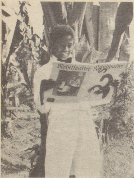
Ein Gruß aus Abessinien

Junger Boy im Kaiserhause Beglückt beguckt er in der Pause Nebihelgen, wildgeformte Weiße Schimmel Bö genormte.