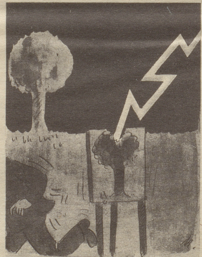
Realismus Söndagsnisse Strix