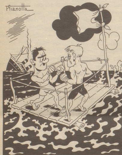
Die schiffbrüchigen Boxer

Auf dem Brandplatz war unsere Feuerwehr tätig. Es blieb vom Haus nichts mehr übrig als der Brunnentrog. fli.