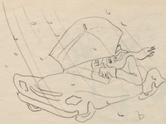
Lob des Sportwagens