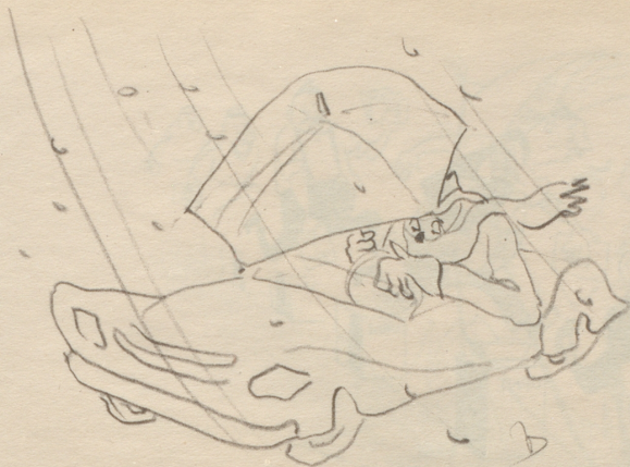
Lob des Sportwagens