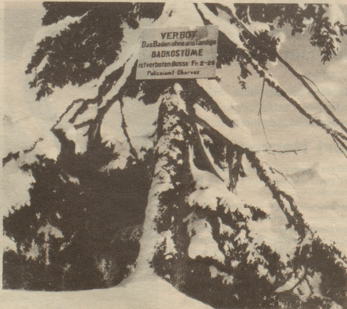
Gestrenge ist das Polizeiamt Obervaz!

Forte stürzt sich der Sopran auf das elegant zugespielte Finale des Alt, das