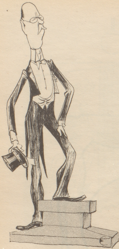
Im Zeichen der Metalldiebstähle

Meine Herren! Da uns das Denkmal gestohlen werden kann, haben wir von dessen Ausführung abgesehen.