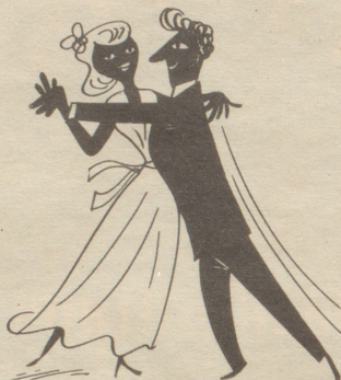
Der Tango ist wohl kaum so ganz ein ausgesprochener Tempeltanz.