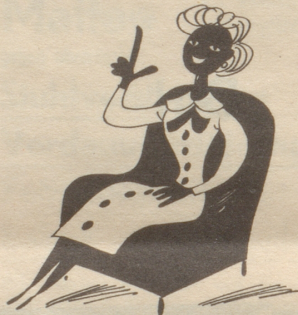
Ein Treffer , wenn auch noch so klein, kann dir ein Trost zumindest sein!