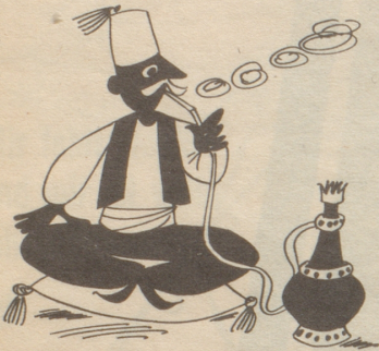
Der Türke fühlt sich erst im Schuss nach reichlichem Tabakgenuss.