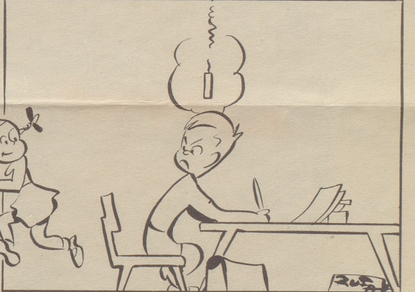
Der Aufsatz „Plötzlich ging mir ein Licht auf, aber meine Schwester hat es mir zleidwerchigerweise wieder ausgeblasen.“