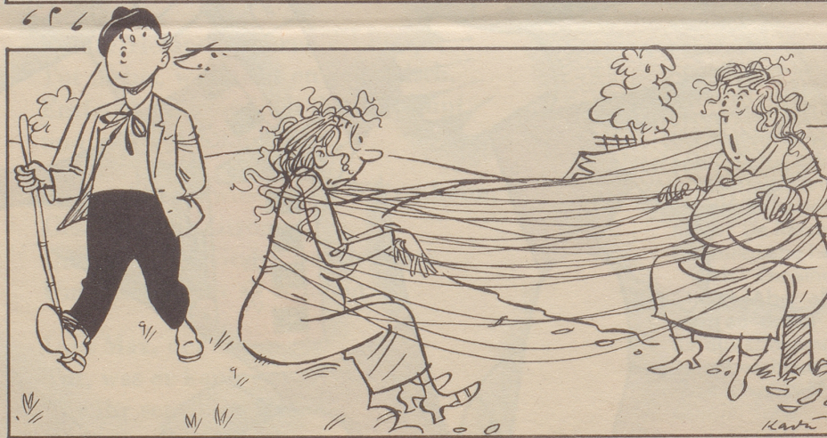
Nicht ins Garn gegangen