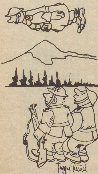
«Ich han ems ja gsait er söll d Uniform nid mit Flugbänzin reinige!» Tyrithans

Vor dem Regierungsgebäude säuberten zwei Männer den Rasen, als ein Windstoß ein Stück Papier vom Boden aufhob, in die Luft wirbelte und es durch das offene Fenster in das Zimmer eines Ministers trieb. Eilig lief der Mann hinterher, kletterte zum Fenster hinauf, kam aber sofort wieder auf den Boden und rief seinem Kollegen zu: «Zu spät, er unterschreibt bereits!»