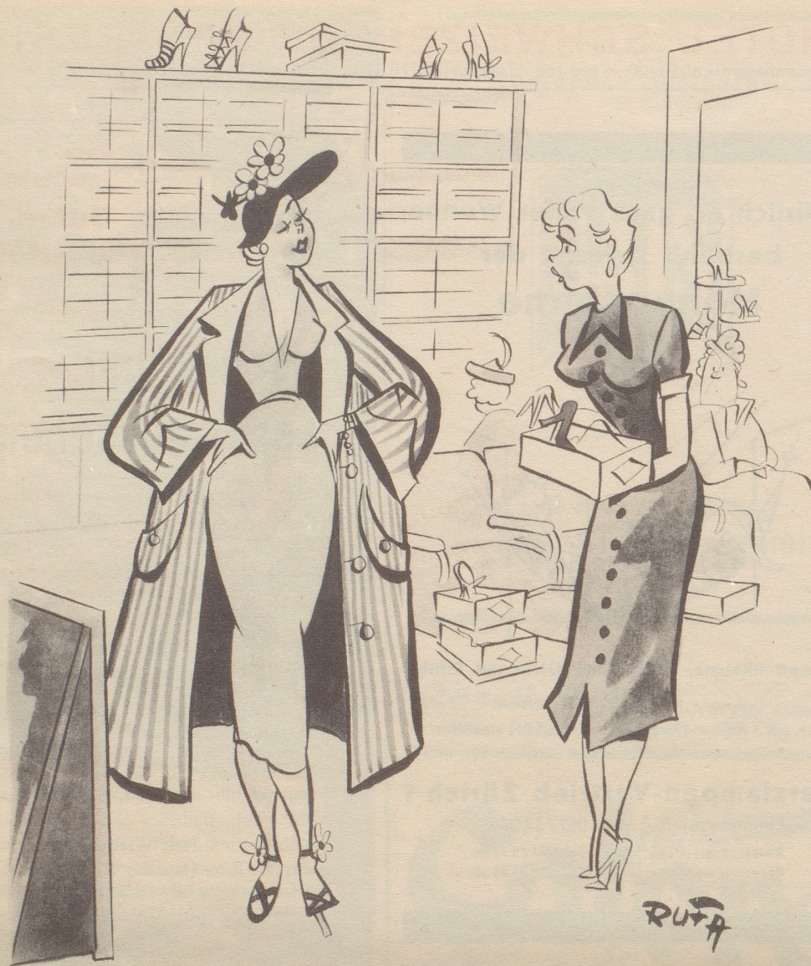
„Die Schüeli passed prezis. Gänzmer die, aber e Nummere chliiner!“