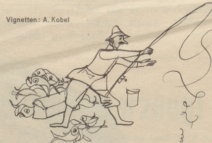
Vignetten: A. Kobel

Die Sport- und anderen Fischer unterscheiden sich von den übrigen nicht-fischenden normalen Menschen durch ihre Ausdauer, mit der sie je nach Methode im oder am Wasser stehen oder sitzen und darauf warten, bis es Abend wird. Für den ahnungslosen und höchstens im trüben fischenden Laien gilt das Fischen (in klaren Wassern) als langweiliger Sport. Es gibt jedoch eine Freizeitbeschäftigung, die noch bedeutend langweiliger ist: den Fischern zuschauen! Die Sportfischer sind bescheidene Leute, solange sie nicht von ihren Fängen zu sprechen beginnen. Dann aber werden Egli zu Forellen, Hechli zu Hechten, Granims zu Kilogramms und die Träumereien von ein paar verfischten Stunden zur vermeintlichen Realität. Weil