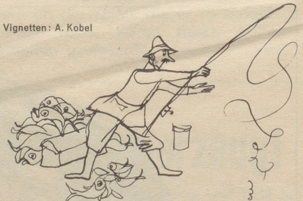
Vignetten: A. Kobel

die Sportfischer von ihrer Umwelt nicht ernst genommen werden, kompensieren sie das damit, daß sie sich selbst sehr ernst nehmen. Das möglichst weite Werfen der Angel ist eine Wissenschaft, und wer daran zweifelt, der macht sich bei den Sportfischern mangelnder Aufgeschlossenheit und Bildung verdächtig. Ein Sportfischer, der seine Ferien nicht an einem Bach, Fluß oder See verbringt, der ist kein echter Sportfischer, und wer mehr Details über den edlen Zweikampf zwischen Mensch und Tier will, der wende sich am besten an die Gemahlin eines Sportfischers. Sie wird ein Liedlein singen können, selbst wenn sie vollständig unmusikalisch veranlagt ist. Solange sich Magglingen jedoch noch nicht mit der Aufnahme der Fischerei in den Sportbetrieb befaßt, und es noch keine der Skitechnik analoge Einheits-Fischtechnik gibt, fischt bei uns in der Schweiz vorderhand noch jeder nach seinem System ... und viele davon im trüben.