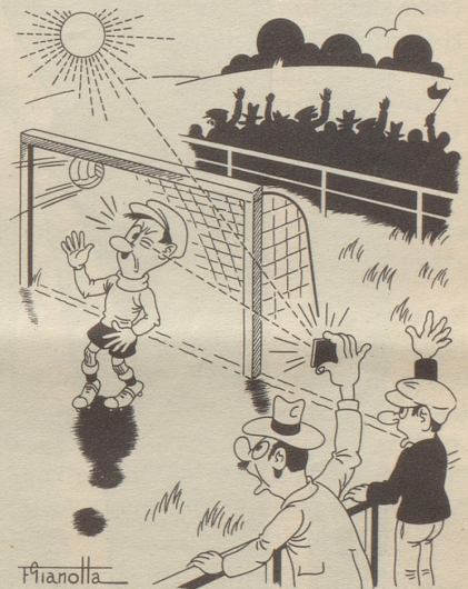
Ein Goal und seine Ursache

Wer kennt nicht die Geschichte von der Matratze! Als man einen Junggesellen, der seinen Haushalt selbst besorgte, fragte, ob er auch alle Morgen seine Matratze kehre, antwortete er: «Säb nöd, aber wenn i si cheer, cheer i si grad zweimol.» Daran wurde ich erinnert, als wir gestern nach dem Nachtessen, wie alle vierzehn Tage, beim Apotheker waren. Das Gespräch kam wieder einmal aufs Frauenstimmrecht. Allgemein war man der Meinung, die Einführung des Frauenstimmrechts sei eine einfache Anstandspflicht. Nur der Apotheker hatte sich noch nicht vernehmen lassen. Man wußte, daß er sich ärgerte, wenn seine Frau ihm vor allen Leuten längliche Reden hielt, wobei man oft nicht recht merkte, was sie eigentlich wollte. Er sagte: «I bi au förs Fraueschtimmrecht. Sogär förs dopplet. Ei Schtimmcharte för de Ma und zwei för dFrau. Scho dMane wössed mengsmol nöd, öb si Jo oder Nei schribe sölled, — ond gär dFraue! Drom wärid zwei Charte ebe gäbig: of eini chönnteds schribe Jo, ond uf di ander Nei. Denn isch allne gholfe. DFraue hend sSchtimmrecht, ond dMane säged wo dore.» MO