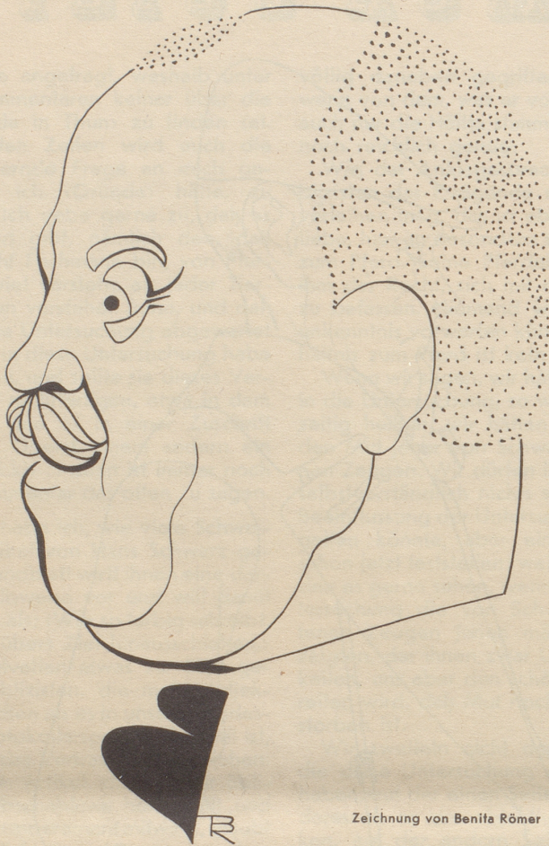
Zeichnung von Benita Römer