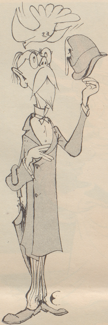
Des Pazifisten große Enttäuschung