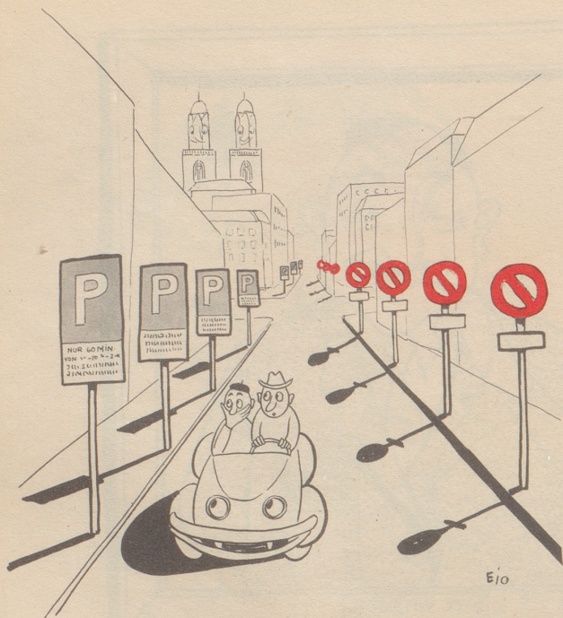
Zürchs neueste Alleen