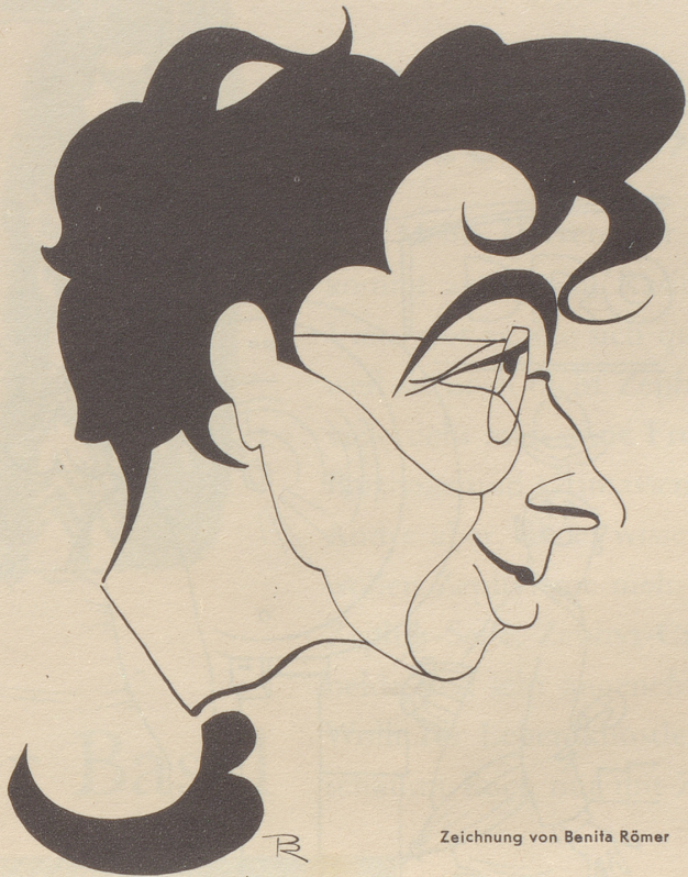
Zeichnung von Benita Römer