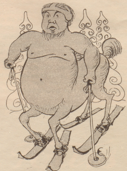
Frei nach Böcklin

Der Besucher kratzte sich mit dem Daumnagel die Kopfhaut und machte ein unentschlossenes Gesicht. «Und das Ding da — die Zeichnung? Ach so — Sie sind ein ganz Gerissener! Jetzt muß