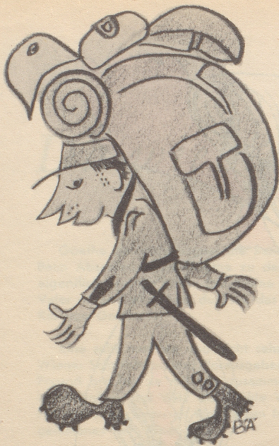
Grüß aus der Rekrutenschule (Karabiner und Patronentasche sind platzhalber weggelassen)