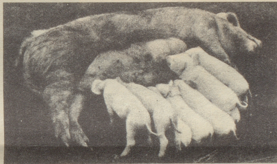
Der Mai ist gekommen Die Säue schlagen aus.