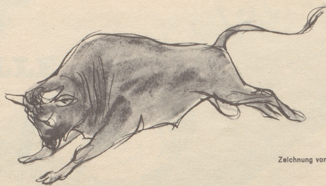
Zeichnung von Alfred Kobel

Dies kurze Geschichtlein stammt aus dem Alten Glarus, das Anno 1861 abgebrannt ist. Da es aber heute noch Richter, Weibel, Bauern und Rindviecher gibt, so sei es hier aufgefrischt.