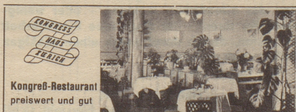
Kongreß-Restaurant preiswert und gut