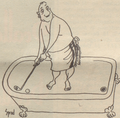
«Sport treiben? Ja, aber in mäßigen Grenzen.»

«Dolce far niente», antwortete sie höflich. Ines