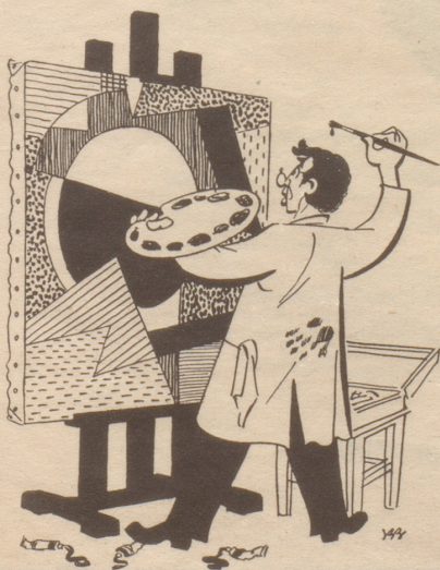
Früher verlangte das Publikum vom Künstler Phantasie, heute verlangt der Künstler vom Publikum Phantasie. Tyrhans

Mitten im vierten Satz der Sinfonie stößt eine Dame ihren Begleiter in die Seite: ‚Du, lueg emal, da vorne schlaaft eine!‘ Unwirsch entgegnet er: ‚Wäge dem heftsch mi nöd müesse weckel!‘ bi