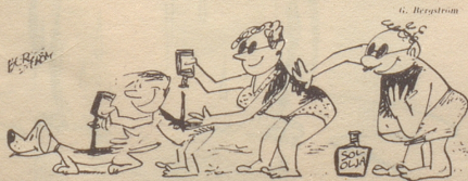
Das Lebensideal Söndagsnisse Strix

Da bummle ich um die heißeste Mittagszeit durch die Strafen und komme am Schaufenster einer Mobiliar-Versicherung vorüber. «Jetzt ist Einbruchzeit – versichern Sie sich rechtzeitig gegen Einbruch!» lese ich da auf einem mächtigen Karton.