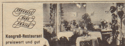
Kongreß-Restaurant preiswert und gut

Ihr Freund empfiehlt: Braustube Hürlimann Zürich am Bahnhofplatz