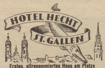
Erstes, altrenommiertes Haus am Platze

In nächster Nummer: Resultat Bildtext-Wettbewerb!