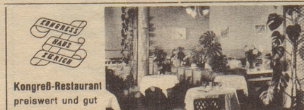
Kongreß-Restaurant preiswert und gut

Ihr Freund empfiehlt: Braustube Hürlimann Zürich am Bahnhofplatz