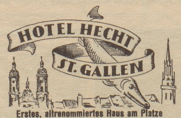
Erstes, altrenommiertes Haus am Platze

In nächster Nummer: Resultat Bildtext-Wettbewerb!