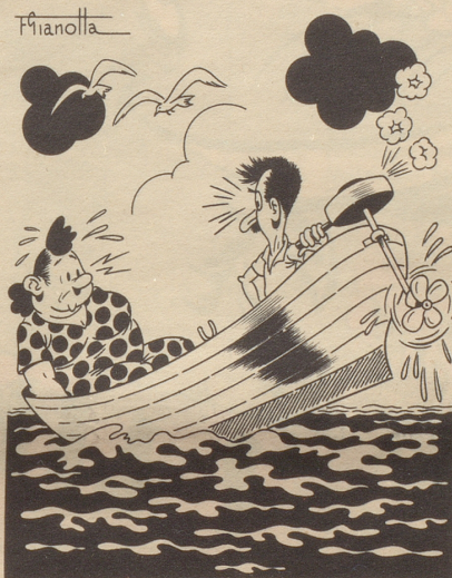
«Werum häsch du es Bööfli gnaa wo de Motor i dr Luft ischt?»