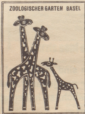
Zoo-Signet — gestern und heute!