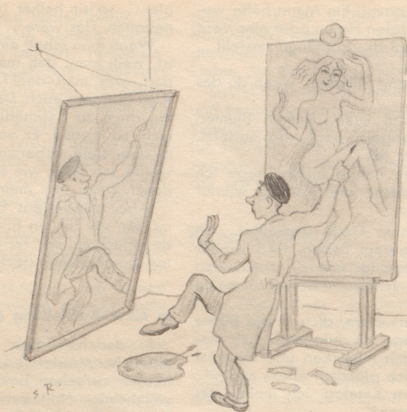
Selbst ist der Mann!

lung, die sie beim Spitzen über sich ergehen lassen müssen. Das Taschenmesser kann doch gar nichts dafür, zudem ist es alt und längst nicht mehr scharf. Aber die Bleistifte sind eben streitsüchtig. Sie zanken auch mit den Kohlestückchen: ‚Ihr macht immer unsere Schachtel schmutzig! Der Rötler wird gar nicht rot dabei, obwohl der Vorwurf eigentlich auch ihn angeht.‘