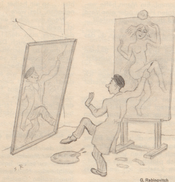
Selbst ist der Mann!