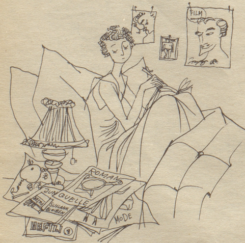
Zeichnungen: Alfred Kobel

18. Juli. Meine eisigen Blicke haben Wunder bewirkt! Er belästigt mich nicht mehr. Allerdings fühlte ich mich heute unsäglich einsam und verlassen. In was für ein trauriges Nest bin ich da nur geraten! Nichts als trostlose Geröllhalden, die einem die Aussicht versperren. Warum bin ich nicht nach Lugano gefahren?