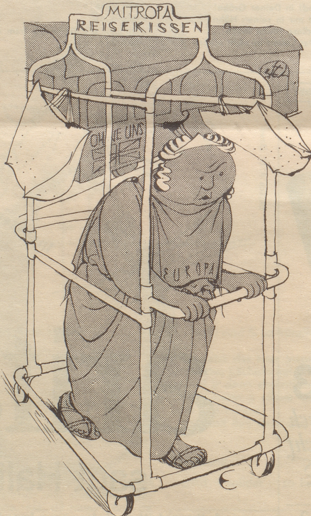
Laufgatter zur Erhaltung des europäischen Gleichgewichts

Einrückungstag. Wir fahren im vollgestopften Bahnwagen von Chur Richtung Engadin. In Tiefenkaastel hält der Zug. Ein Herr Oberst steht am Bahnhof und schaut prüfenden Auges dem Soldatenbetrieb zu. Plötzlich bemerkt einer in unserem Bahnwagen, daß an der Uniform des Herrn Obersten der zweitoberste Knopf offen steht. «Wart dem sägis», ruft ein resoluter Gefreiter. Kaum einer traut ihm jedoch den Mut zu. Beim Wiederanfahren des Zuges reißt der Gefreite das Fenster herunter und brüllt: «Herr Oberscht, Gfreite X., de zweitoberscht Chnopf.» Etwas nervös nestelt der Herr Oberst am verhängnisvollen Knopf, lächelt und grüßt. ThB